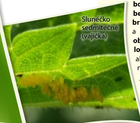
Slunéčko sedmítečné (vajíčka)

Slunéčko sedmítečné má výborné herecké dovednosti - v bezpečí zahraje roli „mrtvého brouka“ stává se zdánlivě mrtvým a bezvládně padá na zem. Dalším obraným mechanismem je vyloučení oranžové šťávy s obsahem alkaloidů, díky které řadě predátorů nechutná a je jedovatá. Podobně jedovaté jsou larvy a kukly. Ptáci si tedy opravdu nesmyslnou!