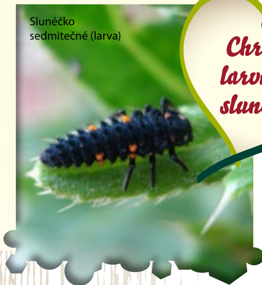
Slunéčko sedmítečné (larva)

Samička na jaře volně naklade žlutavá vajíčka do štěrbin nebo na spodní strany listů rostlin s hojným výskytem mšic. Vyrmené larvy se zakuklí a po týdnu či dvou se vylíhne zbrusu nové slunéčko sedmítečné. Mladá slunéčka přežívají pod listím, v mechu nebo trsu trávy či pod kůrou stromů , teprve druhým rokem se rozmnoží a ještě v létě jejich život končí.